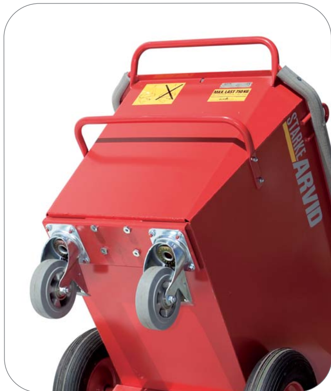
Dubbla länkhjul Dubbla handtag