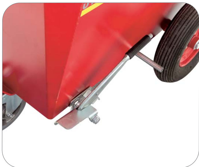
Hand- och fotbroms Polyuretanfyllda hjul