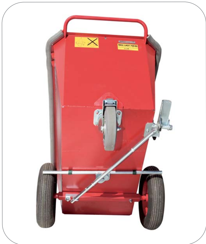
Hand- och fotbroms